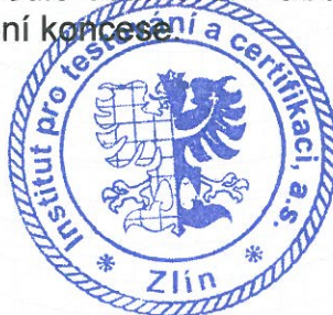
Ing. Pavel Vaněk Ředitel divize certifikace

Tento certifikát může být zrušen podle ustanovení Obecných pravidel týkajících se části odstoupení od koncese nebo zrušení koncese.